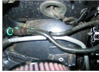
Fig. # 15