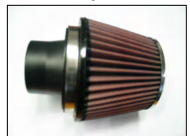
Fig. # 12