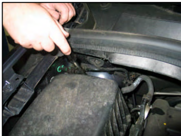
Fig. # 1

FILTER MAINTENANCE: K&N suggests checking the filter periodically for excessive dirt build-up. When the element becomes covered in dirt (or once a year), service it according to the instructions on the Recharger service kit available from your K&N dealer, part number 99-5000 or 99-5050.