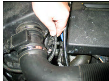
Fig. # 3