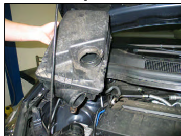
Fig. # 6