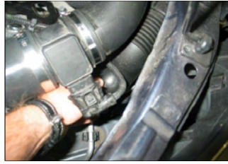
Fig. # 14