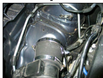
Fig. # 11