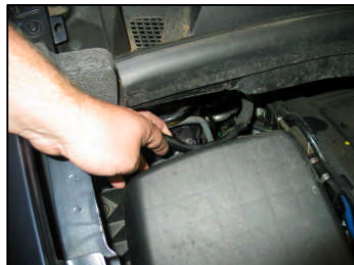
Fig. # 2