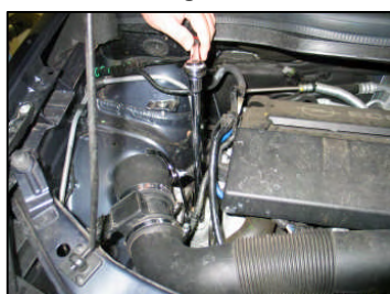
Fig. # 10