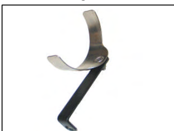
Fig. # 9