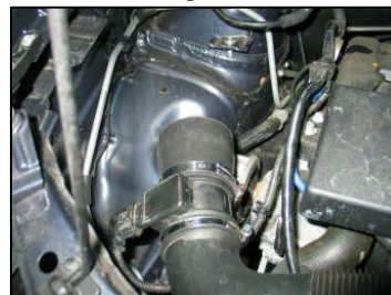
Fig. # 7