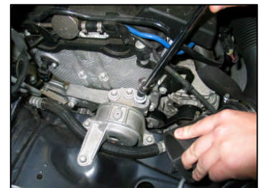
Fig. # 8