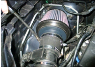
Fig. # 13