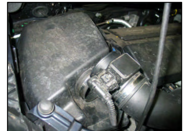
Fig. # 4