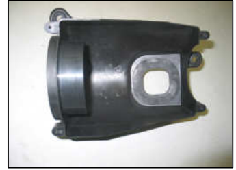
Fig. # 8