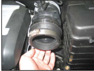
Fig. # 11