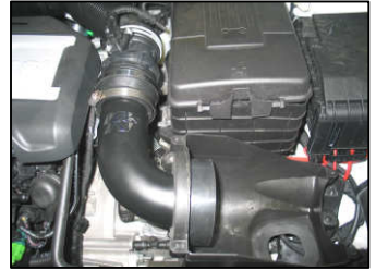
Fig. # 12