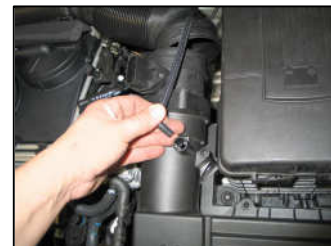
Fig. # 3