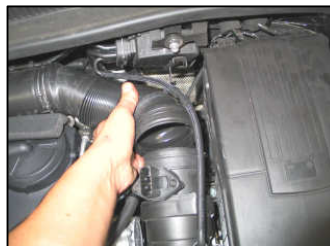
Fig. # 2