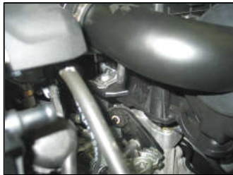
Fig. # 15