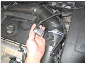
Fig. # 1

For other K&N products and / or more information about the K&N products please visit our website: www.knfilters.com