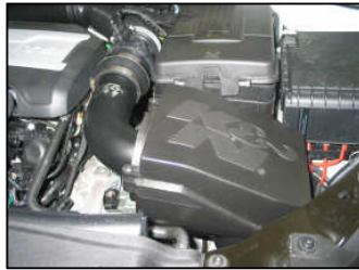
Fig. # 18