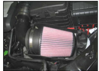
Fig. # 16