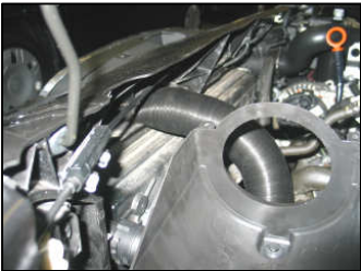
Fig. # 13