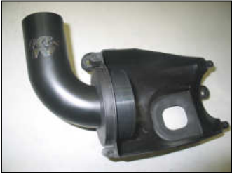
Fig. # 9