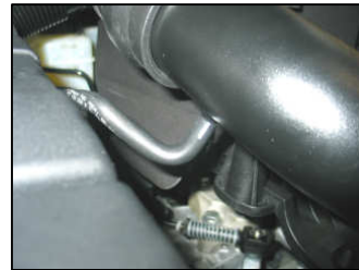
Fig. # 14