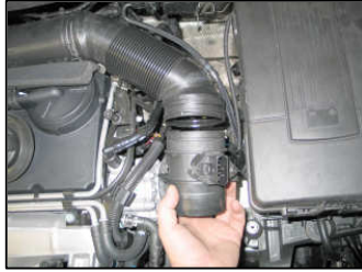
Fig. # 7