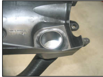
Fig. # 10