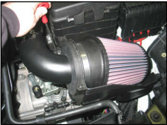
Fig. # 17