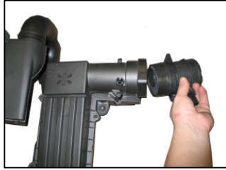
Fig. # 6