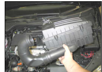
Fig. # 4