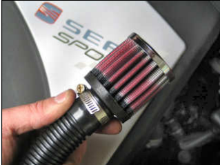
Fig. # 22