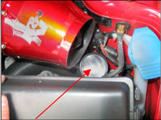
Fig. # 24