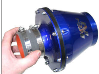
Fig. # 17