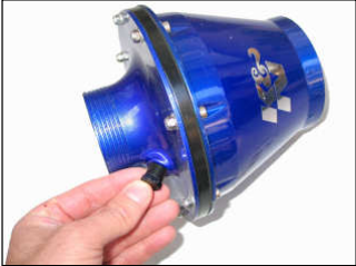
Fig. # 16