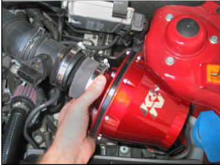
Fig. # 18