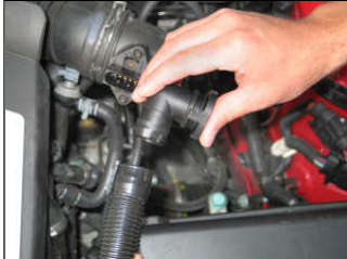
Fig. # 21