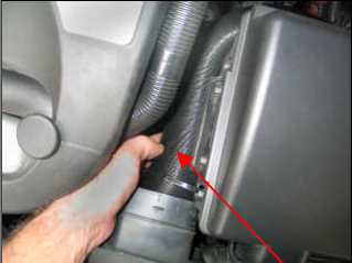
Fig. # 23