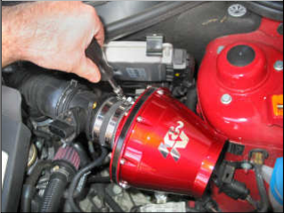
Fig. # 19