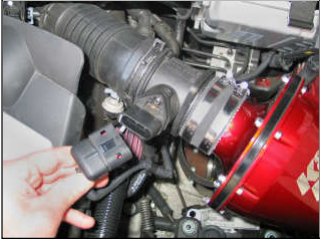
Fig. # 20