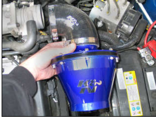
Fig. # 09