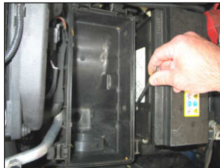
Fig. # 03