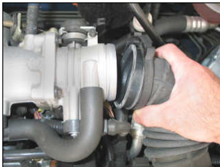
Fig. # 01

FILTER MAINTENANCE: K&N suggests checking the filter periodically for excessive dirt build-up. When the element becomes covered in dirt (or once a year), service it according to the instructions on the Recharger service kit available from your K&N dealer, part number 99-5000 or 99-5050.