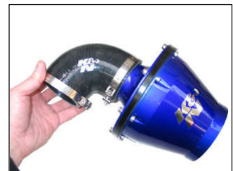
Fig. # 08