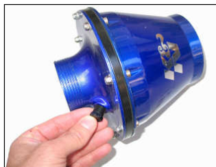
Fig. # 07