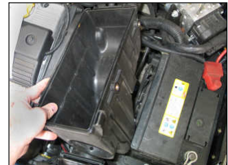
Fig. # 04