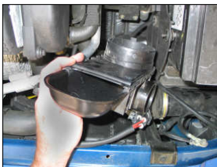
Fig. # 05