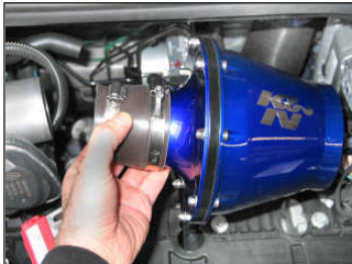
Fig. # 13