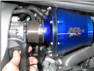
Fig. # 14