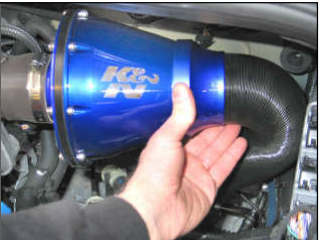
Fig. # 16