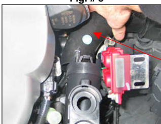
Fig. # 9