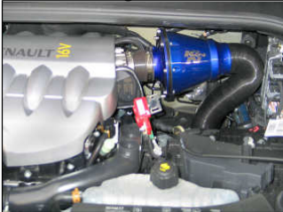
Fig. # 18