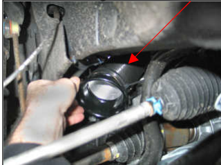
Fig. # 17