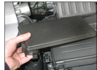
Fig. # 4