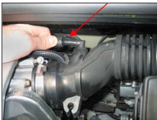
Fig. # 1

FILTER MAINTENANCE: K&N suggests checking the filter periodically for excessive dirt build-up. When the element becomes covered in dirt (or once a year), service it according to the instructions on the Recharger service kit available from your K&N dealer, part number 99-5000 or 99-5050.