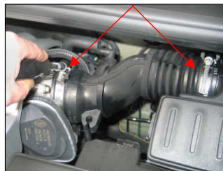
Fig. # 2