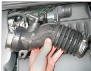
Fig. # 3