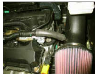
Fig. # 19