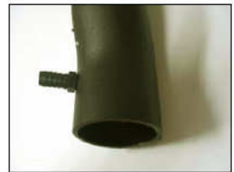
Fig. # 16