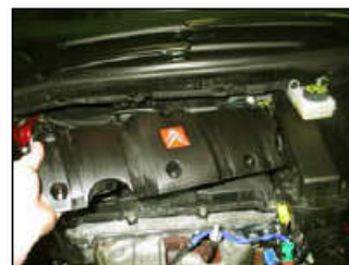
Fig. # 3