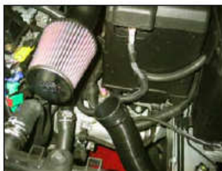
Fig. # 21