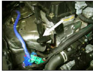
Fig. # 10