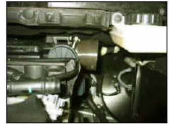
Fig. # 12