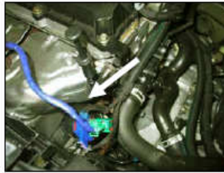
Fig. # 11