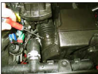
Fig. # 1

For cleaning instructions please visit our website: www.knfilters.com/cleaning