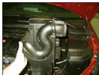
Fig. # 2