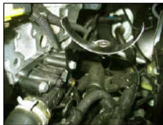
Fig. # 14