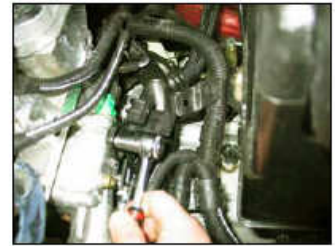
Fig. # 8