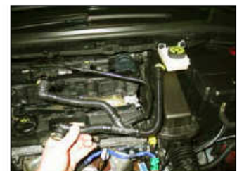
Fig. # 4