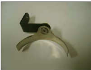
Fig. # 13