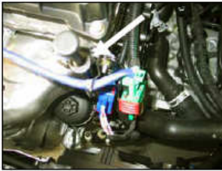
Fig. # 9