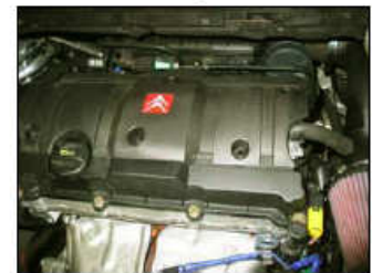
Fig. # 20