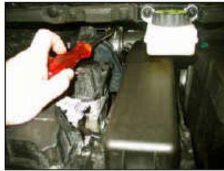
Fig. # 6