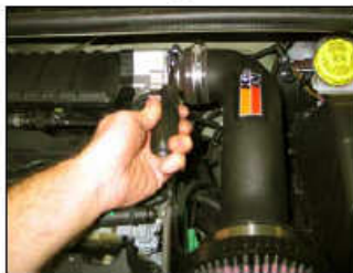
Fig. # 17