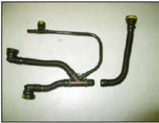
Fig. # 5