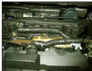
Fig. # 15