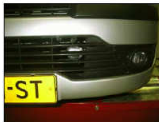
Fig. # 22