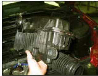
Fig. # 7