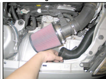
Fig. # 14