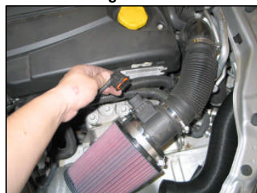
Fig. # 13