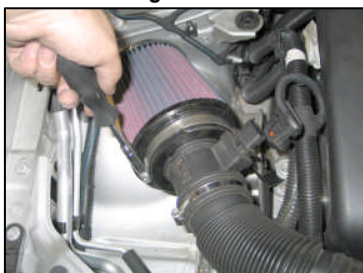
Fig. # 12