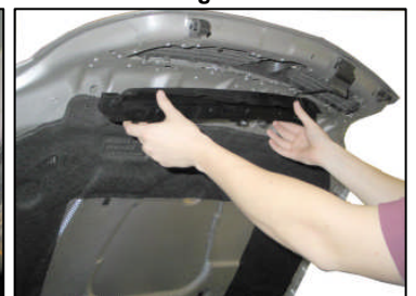
Fig. # 15