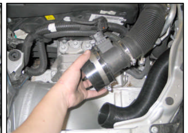
Fig. # 11