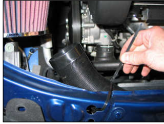
Fig. # 18