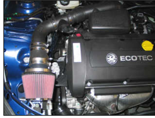
Fig. # 19