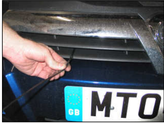
Fig. # 17