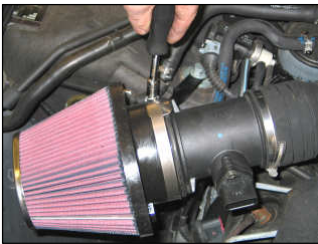
Fig. # 21