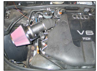
Fig. # 24