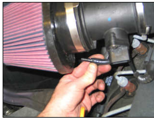
Fig. # 22